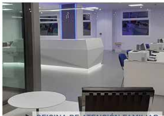
OFICINA DE ATENCIÓN FAMILIAR ZONA COMERCIAL Hospital Universitario