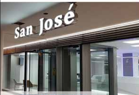
OFICINAS CENTRALES C/Pintor Miró 1 - Frente Hospital