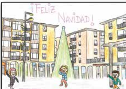
Paola Sainz-Aja González 2º ESO

DEL 1 DE DICIEMBRE DE 2025 AL 9 DE ENERO DE 2026 EXPOSICIÓN DEL CONCURSO DE POSTALES NAVIDEÑAS